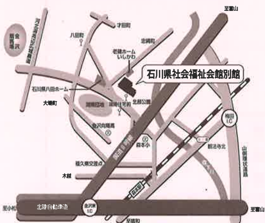
石川中央校 会場案内図