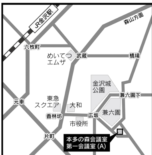
[9月28日・11月8日] 本多の森会議室 (石川県本多の森庁舎内)